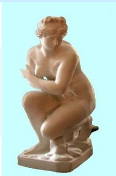
Nörrenberg: erste Daguerrographie in Deutschland (Ludwigsburger Keramik) Im Stadtmuseum