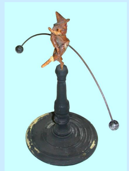
Balanziertänzer Hersteller u. Alter unbekannt

Einige Geräte der Physik befinden sich in den Vitrinen im ersten Stock dieses Hörsaalzentrums