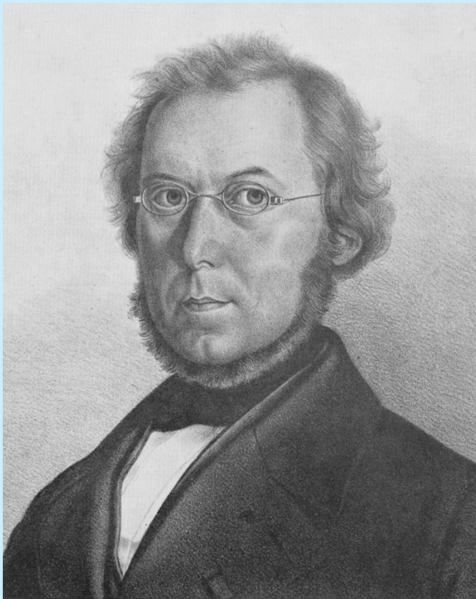
Hugo von Mohl (1805-1872)

Botaniker und Protagonist der Fakultätsgründung 1863