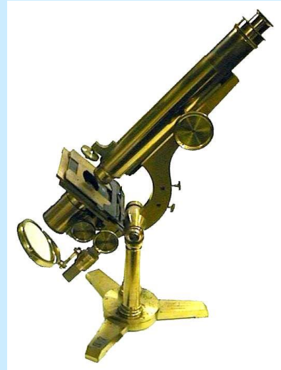
Smith & Beck ,large best microscope', 1857

Mit der Fakultätsgründung wollte er die Naturwissenschaften aus dem Joch der Medizin und Philosophie befreien